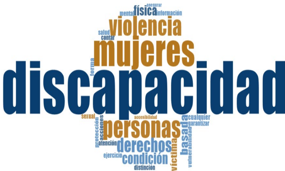
Figura 3. Marca de nube de la aparición de la palabra discapacidad.

Centrándose en el uso de la palabra discapacidad en la normativa vigente revisada para la presente investigación, la Figura 3 destaca discapacidad, mujeres, violencia, derechos, condición . La violencia física aparece en el puesto ocho, mientras que la violencia sexual está en el lugar 22.