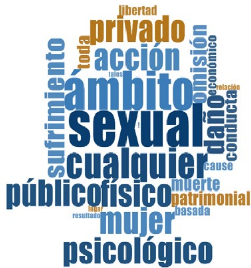
Figura 2. Marca de nube del concepto de violencia.

Centrándose en el uso de la palabra discapacidad en la normativa vigente revisada para la presente investigación, la Figura 3 destaca discapacidad, mujeres, violencia, derechos, condición . La violencia física aparece en el puesto ocho, mientras que la violencia sexual está en el lugar 22.