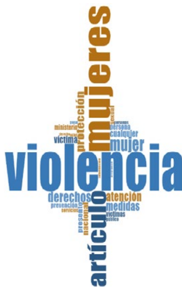
Figura 1. Nube de palabras del proyecto.

La nube de palabras que se presenta a continuación recoge los conceptos/palabras más utilizadas en las leyes analizadas de los países que conforman la presente investigación.